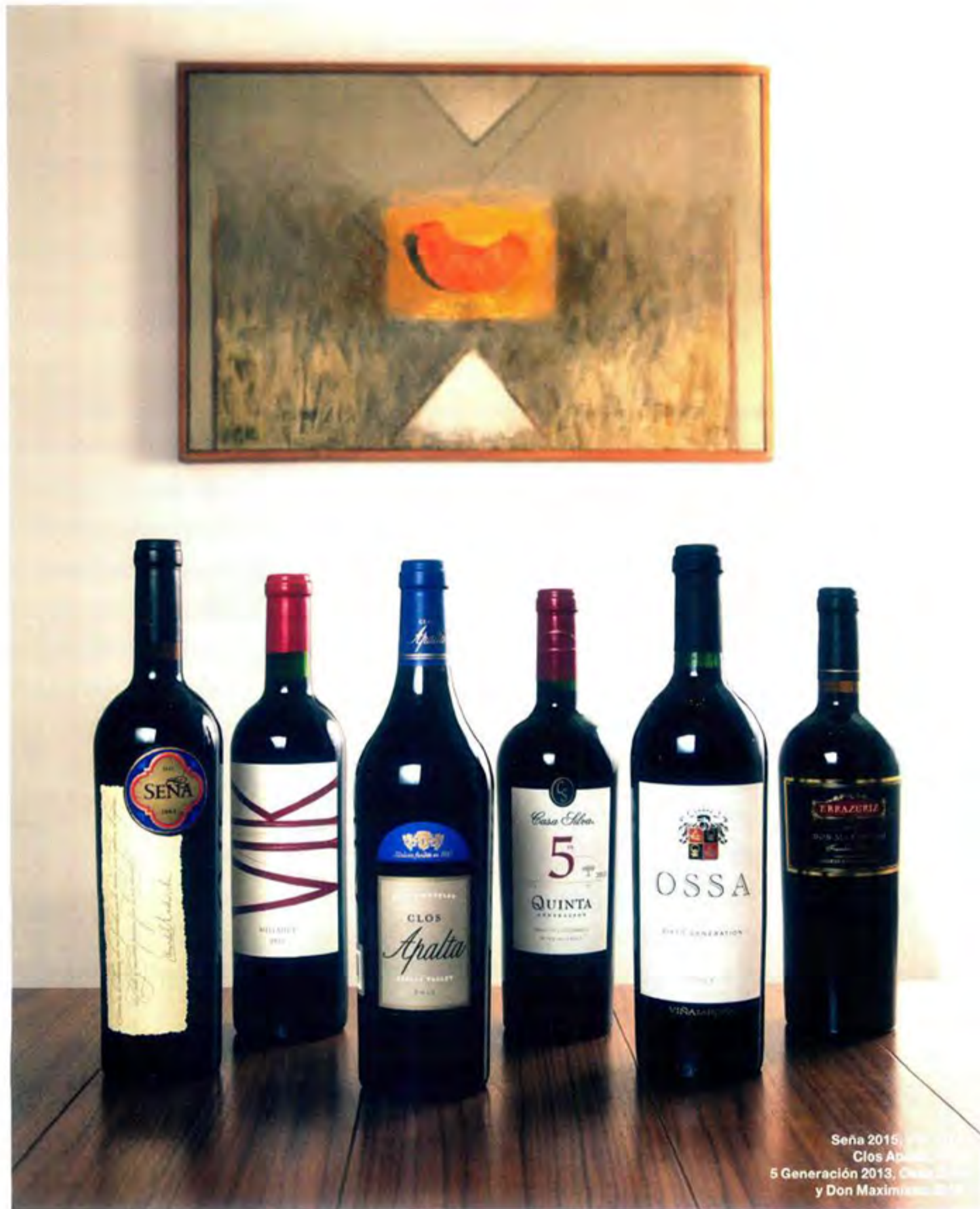
Sena 2015, Clos Apalta 2013, Quinta 5 Generación 2013, Ossa 2013 y Don Maximiano 2014